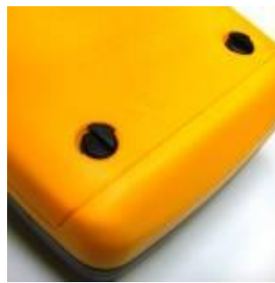
Крепёж крышки батарейного отсека