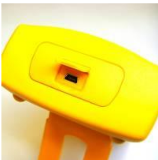
Разъём для подключения адаптера (конвертор для опционального внешнего модуля давления)