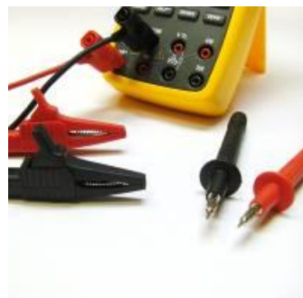
Зажимы "крокодил" и щупы