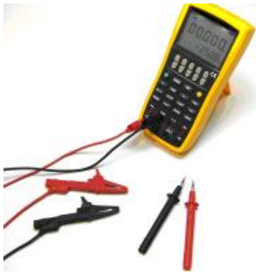
Порядок соединения проводов и наконечников