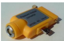
адаптер A000018 (опция)