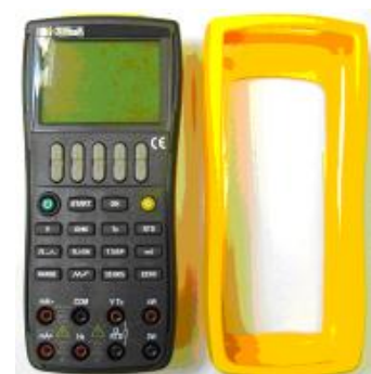
Съемный защитный чехол