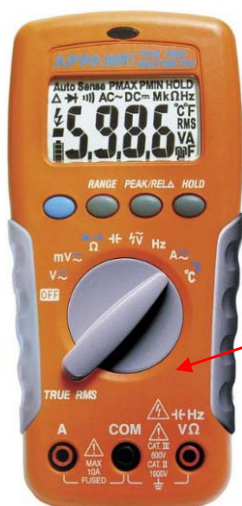
APPA 66R, APPA 66RT