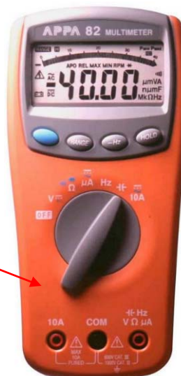
APPA 80, APPA 82, APPA 82R