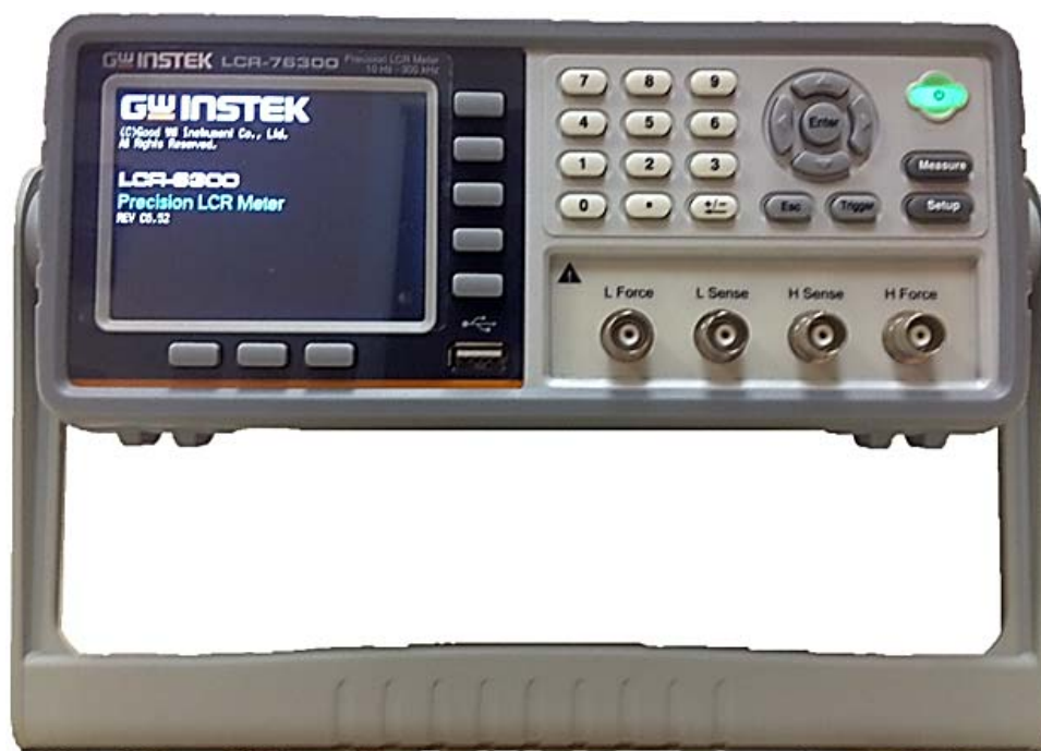
Рисунок 1 - Общий вид измерителей иммитанса LCR-76002, LCR-76020, LCR-76100, LCR-76200, LCR-76300

Общий вид измерителя представлен на рисунке 1. Схема пломбировки от несанкционированного доступа представлена на рисунке 2.