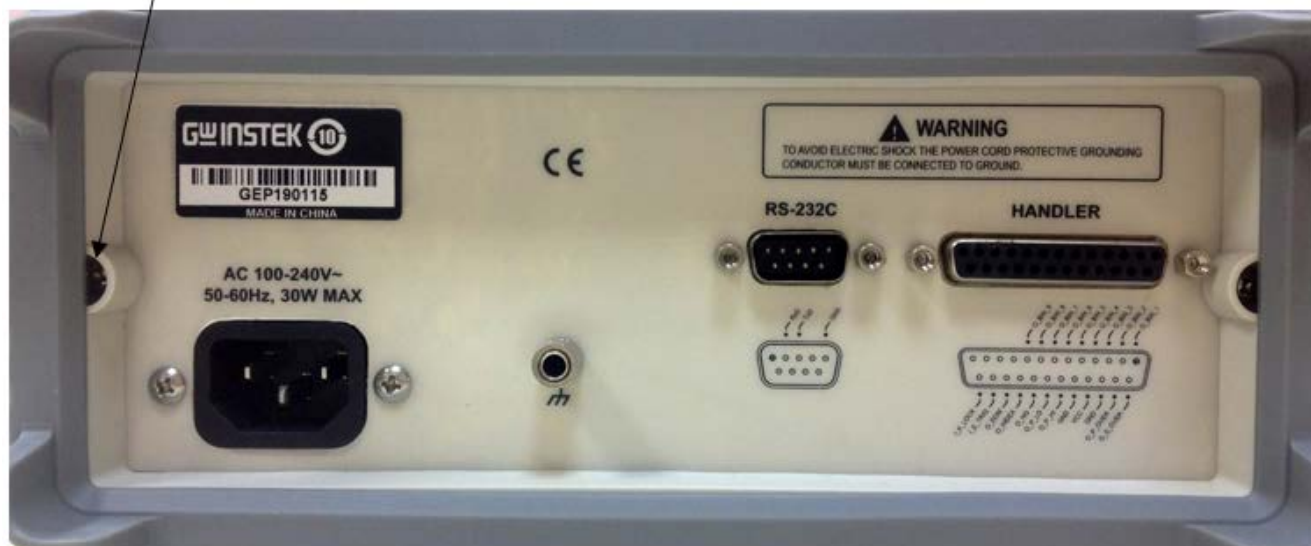
Рисунок 2 - Схема пломбировки от несанкционированного доступа

Схема пломбировки от несанкционированного доступа