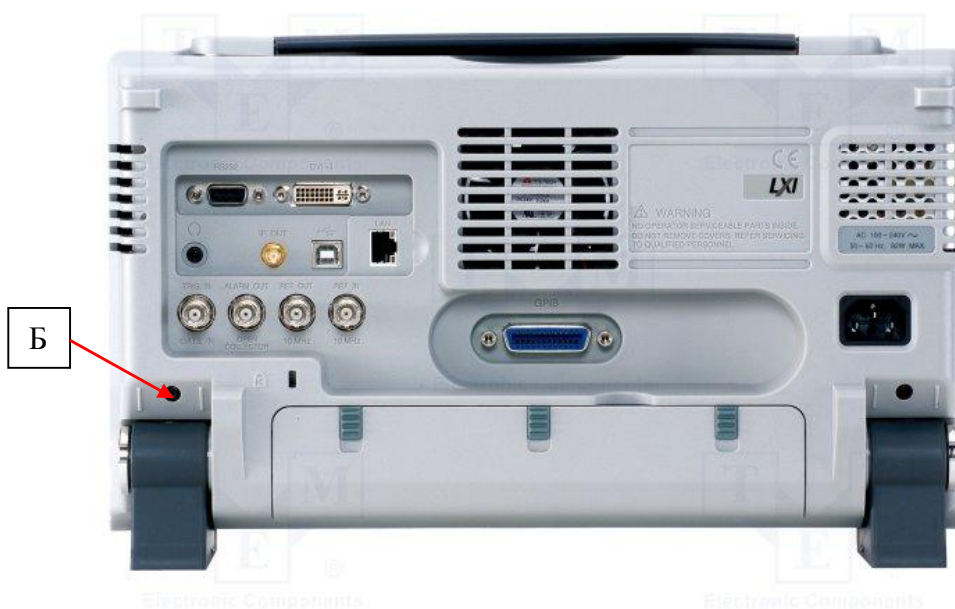
Рисунок 2 – Вид задней панели анализаторов и место пломбировки от несанкционированного доступа (Б)