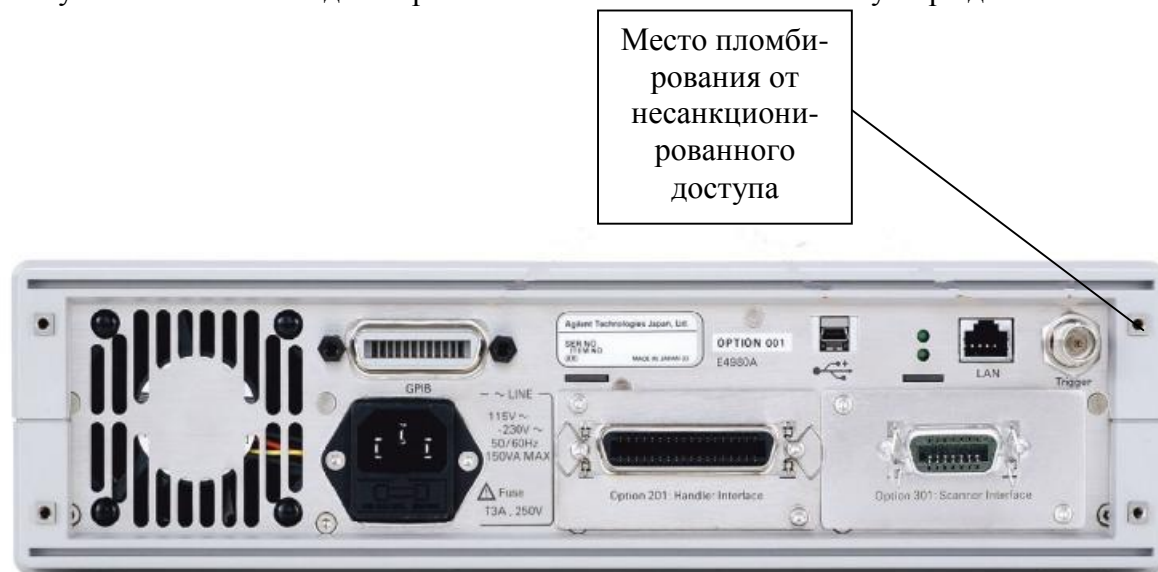
Рисунок 2 - Место пломбирования от несанкционированного доступа