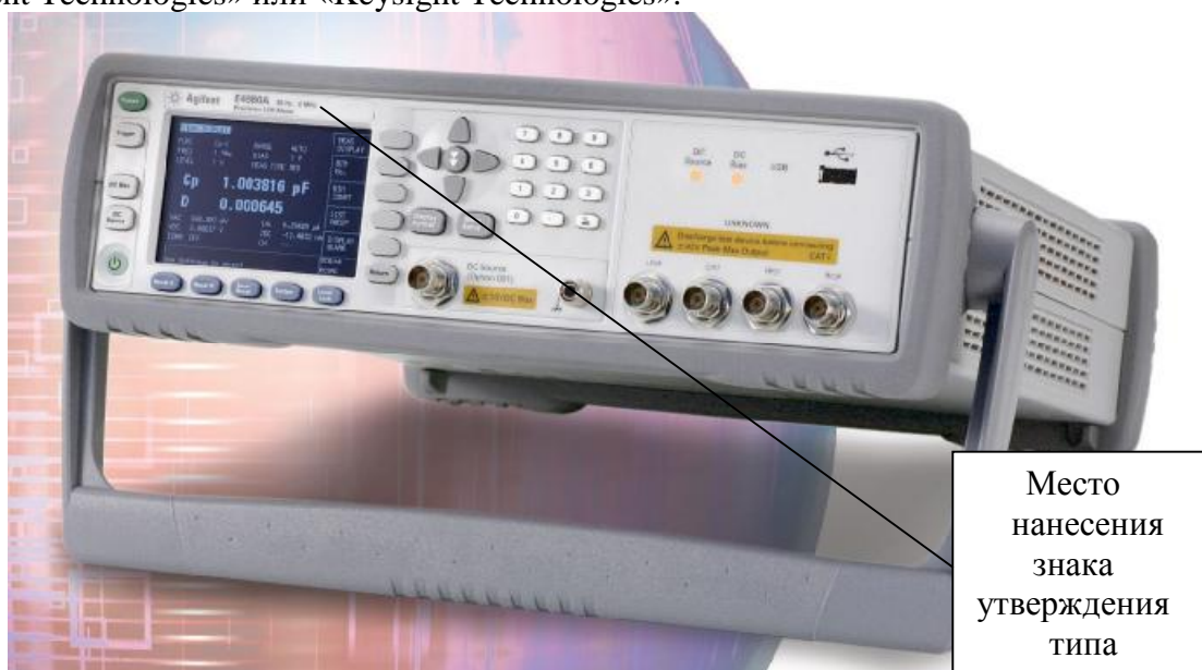
Рисунок 1 Внешний вид измерителей и место нанесения знака утверждения типа

При оформлении внешнего вида измерителей могут использоваться логотипы компаний «Agilent Technologies» или «Keysight Technologies».