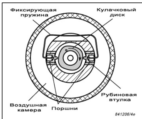
Рис. 1. Поперечный разрез. Описание принципа работы акустического резонатора.

Акустический резонатор типа 4228 обеспечивает быструю и точную калибровку приборов измерения параметров звука, включая шумомеры. Акустический резонатор со встроенным барометром удовлетворяет требованиям стандарта IEC 942 (1988) класса 1L, а с внешним барометром – классу 0L стандарта IEC 942 (1988). Кроме того, прибор соответствует стандарту ANSI S1.40-1984. Акустический резонатор может применяться в широком диапазоне температур, влажности и давления, обеспечивая при этом высокую точность. Акустический резонатор особо полезен при необходимости обеспечения эталонного уровня звукового давления.