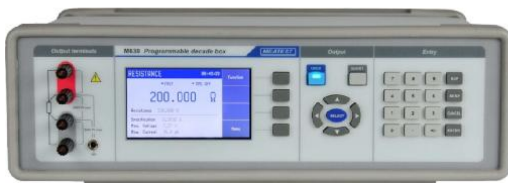
Рисунок 4 – Фотография передней панели магазина M630