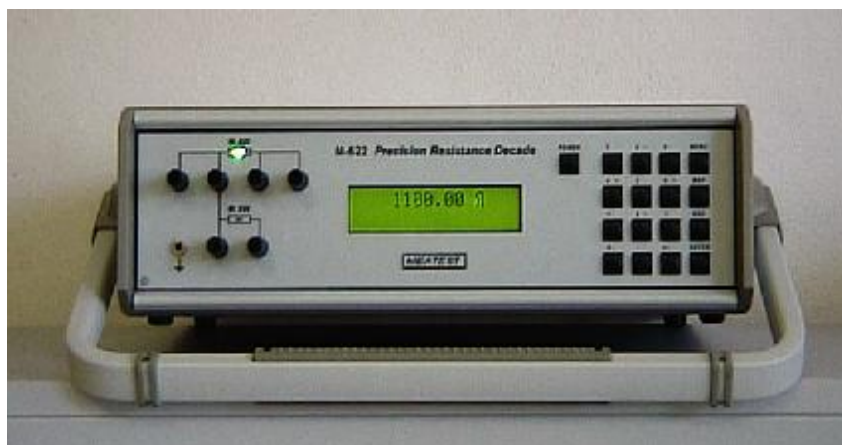
Рисунок 3 – Фотография передней панели магазина M622