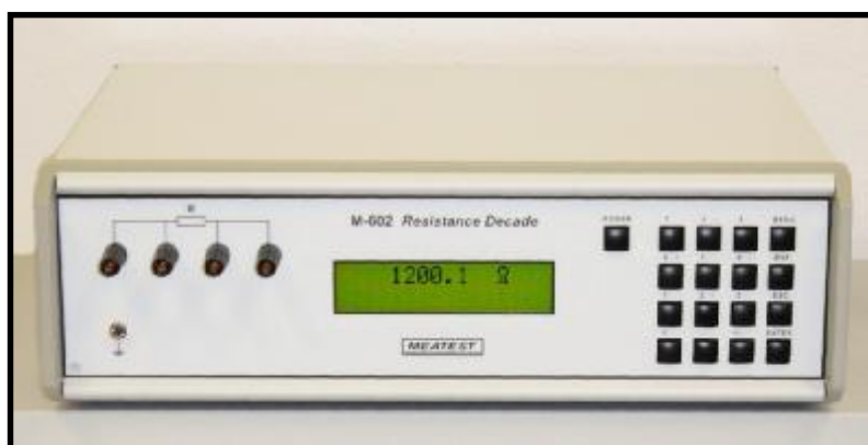
Рисунок 2 – Фотография передней панели магазина М602