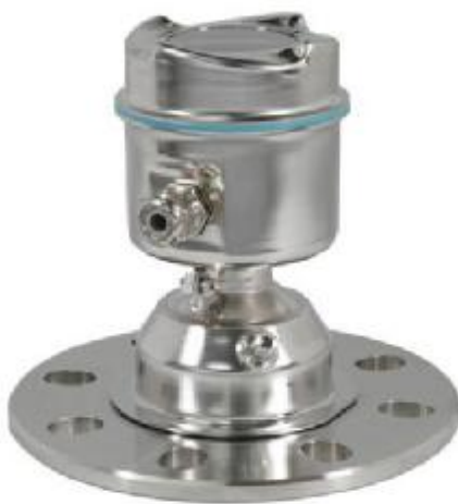
Рисунок 1 – Внешний вид датчиков уровня радиоволновых Sitrans LR560

Внешний вид датчиков представлен на рисунке 1.