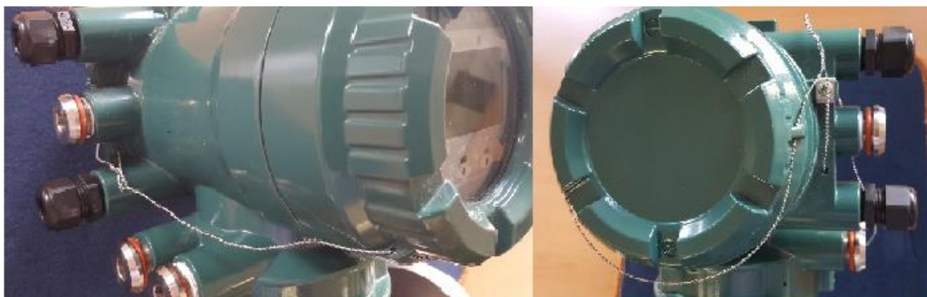
Рисунок 3 - Место пломбировки от несанкционированного доступа