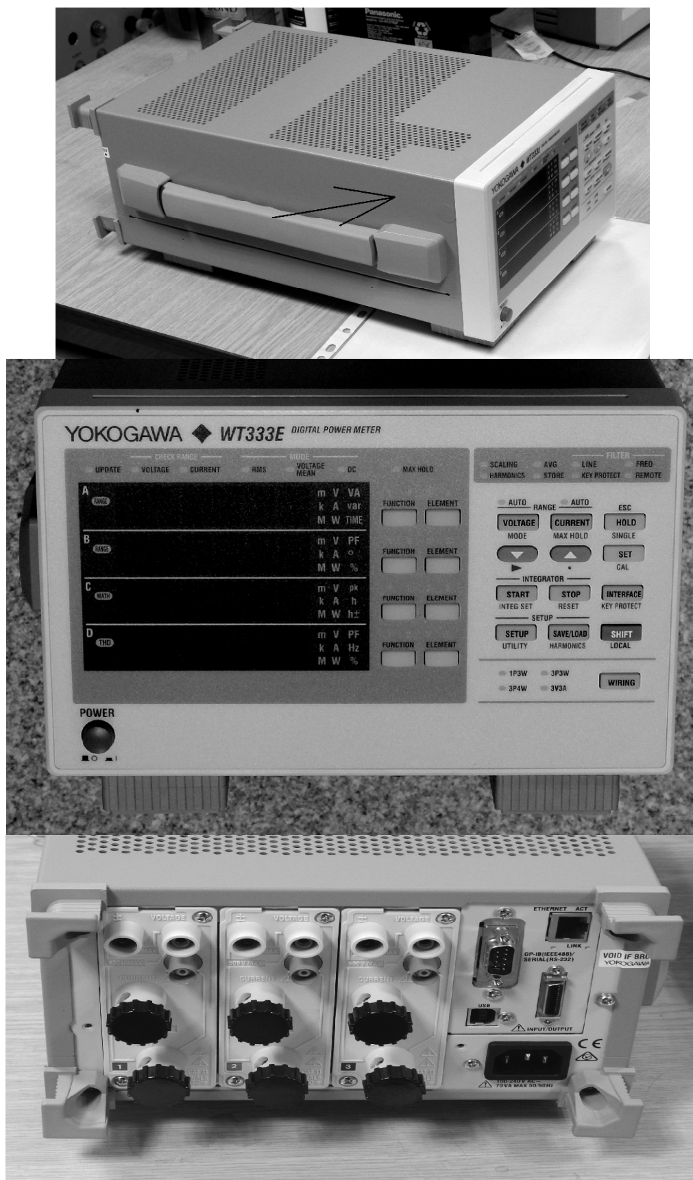
Рисунок 2 - Внешний вид измерителя WT333E Стрелкой показано место нанесения знаков утверждения типа и поверки