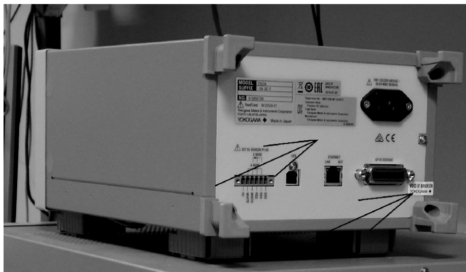
Рисунок 2 - Источник напряжения и силы постоянного тока эталонный 2553А, вид сзади

Стрелками показаны места нанесения знаков утверждения типа и поверки, а также специальная наклейка для опломбирования.