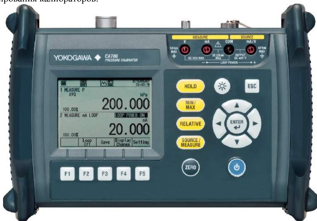
Рисунок 1 – Общий вид калибраторов CA700

На рисунке 1 приведён общий вид калибраторов, на рисунке 2 приведена схема пломбирования калибраторов.